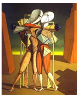
G. DE CHIRICO, Ettore e Andromaca , 1917