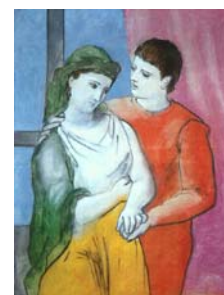
P. PICASSO, Gli amanti , 1923

«Tra l'altre distinzioni e privilegi che le erano stati concessi, per compensarla di non poter esser badessa, c'era anche quello di stare in un quartiere a parte. Quel lato del monastero era contiguo a una casa abitata da un giovine, scellerato di professione, uno de' tanti, che, in que' tempi, e co' loro sgherri, e con l'alleanze d'altri scellerati, potevano, fino a un certo segno, ridersi della forza pubblica e delle leggi. Il nostro manoscritto lo nomina Egidio, senza parlar del casato. Costui, da una sua finestrina che dominava un cortiletto di quel quartiere, avendo veduta Gertrude qualche volta passare o girandolar lì, per ozio, allettato anzi che atterrito dai pericoli e dall'empietà dell'impresa, un giorno osò rivolgerle il discorso. La sventurata rispose.»